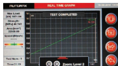
El ensayo ha finalizado y los resultados son precisos