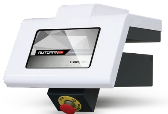
Automax Pro con impresora incorporada

Instalación de una impresora en el panel de control de la AUTOMAX PRO que permite la impresión de la gráfica carga/tiempo.